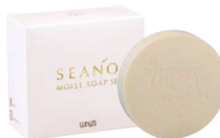
シアノモイスト ソープ 2,625円(本体2,500円)