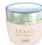
シアノモイスト クリーム 5,250円(本体5,000円)