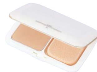
モイストパウダーファンデーション