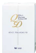
プラセンタエキス FD 10,500円(本体10,000円)