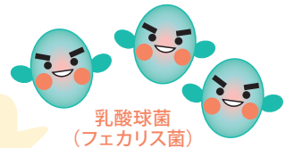
乳酸球菌 (フェカリス菌)

乳酸菌の一種で、もともとは健康な人の小腸から発見されました。現代ではこの乳酸球菌がからだにとって有益な働きをもたらすことが多くの研究から分かってきています。